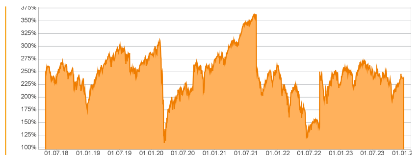
Source: Leonteq Securities AG, 2023. Historische Daten sind kein verlässlicher Indikator für zukünftige Entwicklungen. Daten vom 30.04.2018 bis 31.12.2023